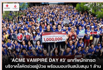
'ACME VAMPIRE DAY #3' ยกทัพนักทรง บริจาคโลหิตช่วยผู้ป่วย พร้อมมอบเงินสนับสนุน 1 ล้าน

เทรตเตอร์ร่วมบริจาคโลหิตและมอบเงินบริจาค 1,000,000 บาท ในกิจกรรม “ACME VAMPIRE DAY #3” ณ ศูนย์บริการโลหิตแห่งชาติ