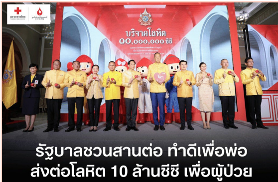
รัฐบาลชวนสานต่อ กำดีเพื่อพ่อ ส่งต่อโลหิต 10 ล้านซีซี เพื่อผู้ป่วย