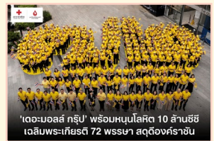
'เดอะมอลล์ กรุ๊ป' พร้อมหนุนโลหิต 10 ล้านซีซี เฉลิมพระเกียรติ 72 พรรษา สดุดีองค์ราชัน