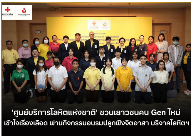
'ศูนย์บริการโลหิตแห่งชาติ' ชวนเยาวชนคน Gen ใหม่ เข้าใจเรื่องเลือด ผ่านกิจกรรมอบรมปลูกฝังจิตอาสา บริจาคโลหิตฯ