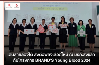
เดินสายส่งต่อ ส่งต่อพลังเลือดใหม่ ณ บสภ.สงขลา กับโครงการ BRAND'S Young Blood 2024